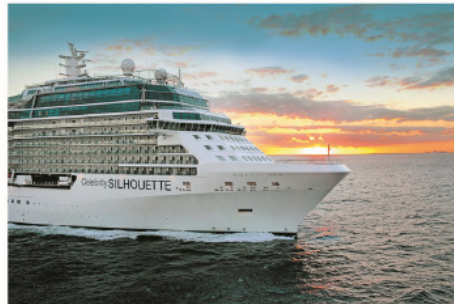
遊輪資料 (菁英嘉印號) 首航: 2011年7月 | 排水量: 122,000噸 | 載客量: 2,850人