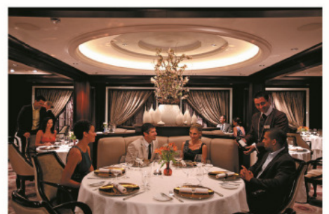
Murano法國餐廳 賦予客人獨特的菁英用餐藝術