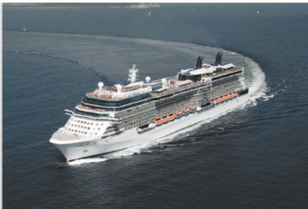
遊輪資料 (菁英水映號) 首航: 2012年11月 | 排水量: 122,000噸 | 載客量: 2,850人