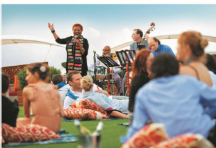
Lawn Club Band 下午躺在綠茵俱樂部的真草皮上細聽樂隊輕鬆音樂