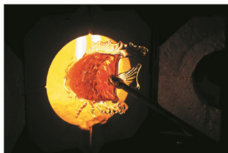
Hot Glass Show 海上首個熱玻璃燒製表演 Hot Glass Show