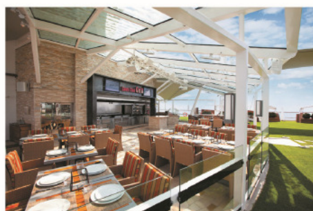
Lawn Club Grill 寫意環境中品嚐戶外燒烤