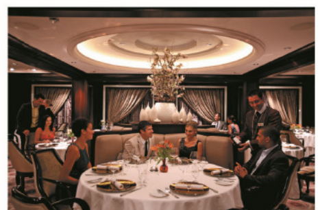
Murano法國餐廳 賦予客人獨特的菁英用餐藝術