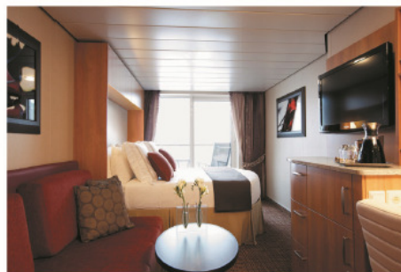
Aqua Class 艙房 人住此艙房的客人可優先往Blu專屬餐廳享用膳食