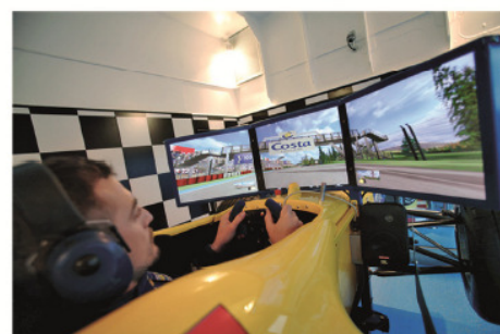
格蘭披治賽車模擬試駕