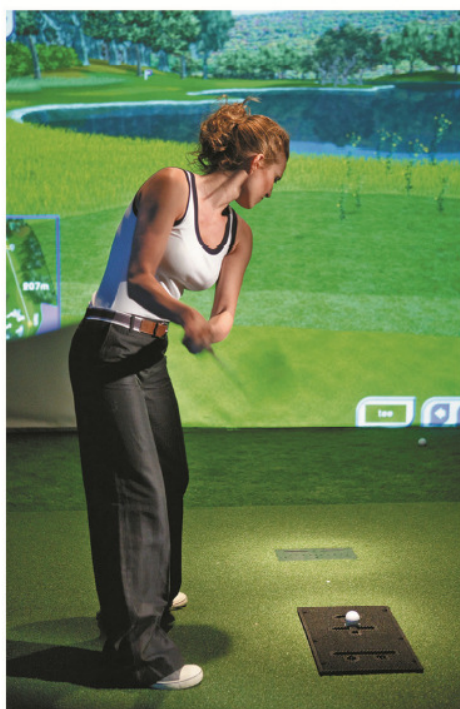
模擬高爾夫球練習場