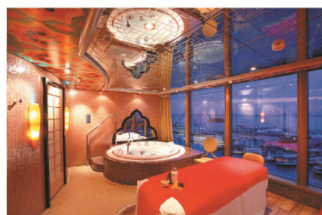
Samsara Spa 護理室