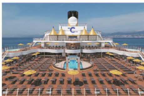
Lido di Propora甲板

2011年7月推出的「Costa Favolosa至臻號」是巧奪天工的精心傑作，其設計靈感來自世界上最美麗的地方和最宏偉的建築，如北京之紫禁城、法國之凡爾賽宮等；而船上更收藏了400藝術品原作。遊輪更打造了與眾不同之4C Wonder—模擬高爾夫球練習場、4D 影院、Playstation 世界及格蘭披治賽車模擬試駕，讓不同年齡層的客人帶來無限娛樂！在遊輪上專門建造了能直接通往Samsara Spa水療中心的Samsara客艙及套房，體驗特色的土耳其浴後，客人更可前往專屬Samsara餐廳享用精緻午餐或晚餐。