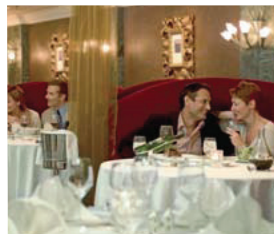
皇后號的英式傳統優越服務，令每位旅客都永遠難忘。