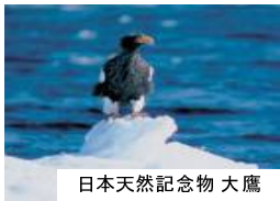
日本天然記念物 大鷹

Hotel Shiretoko (8:00) / Shiretoko Daiichi Hotel (8:05) / Shiretoko Prince Hotel Kazanamiki (8:10) / Shiretoko Grand Hotel Kitakobushi (8:15) ⇒ 雙美瀑布 (8:30-8:40) ⇒ Kanihonjin Yuaisou (10:30) / Abashiri Kanko Hotel (10:35) / Hotel Abashirikoso (10:40) / Hokutenno oka Lake Abashiri Tsuruga Resort (10:50) ⇒ 美幌峠 (12:20-12:40) ⇒ 川湯 湯之園 自費午餐 (13:20-14:10) ⇒ 硫黃山(從車窗) ⇒ 摩周湖 (15:05-15:30) ⇒ 阿寒地區酒店 (16:45-17:00 不順序停車) Akan Yukunosato Tsuruga / Hotel Gozensui / New Akan Hotel / Akan Tsuruga Bessou Hinanoza / Akan-no-mori Hotel Hanayuka / Hotel Akankoso ⇒ 道の駅 (休息約10分鐘) ⇒ 十勝川溫泉地區酒店 (19:10-19:20 不順序停車) Sasai Hotel / Kangetsuen / Tokachigawa Daiichi Hotel